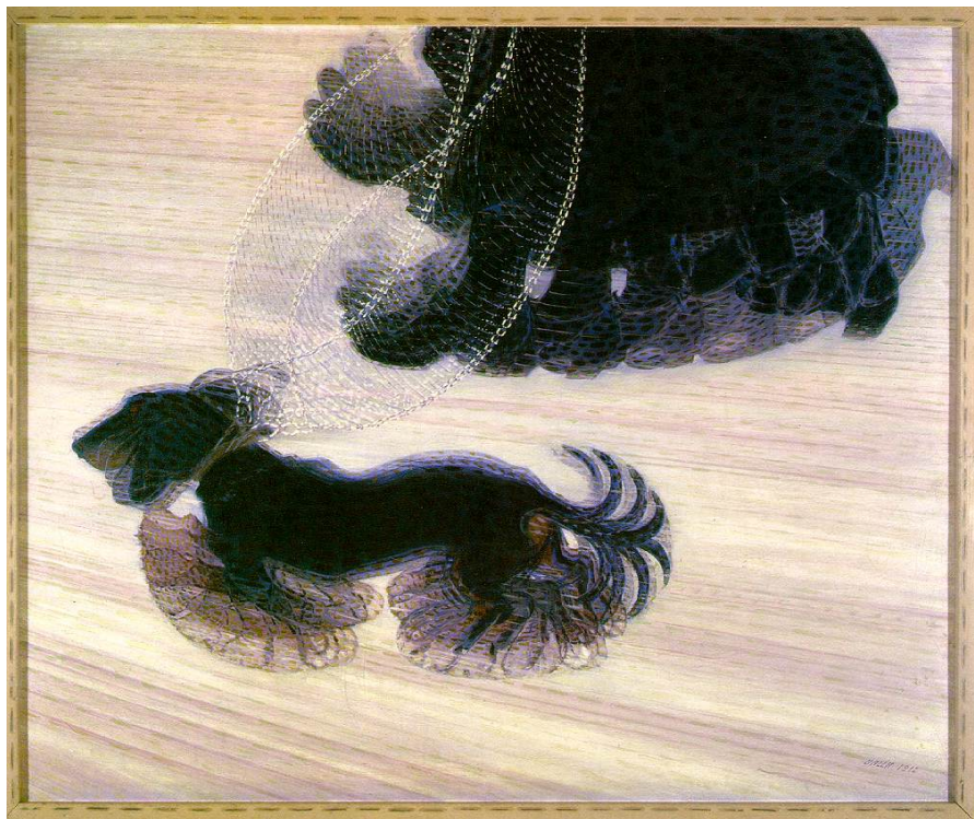
Giacomo Balla Dynamisme d'un chien Huile sur toile, 1912 90 x 110 cm Art Gallery Bufalo, New York Mouvement : Futurisme